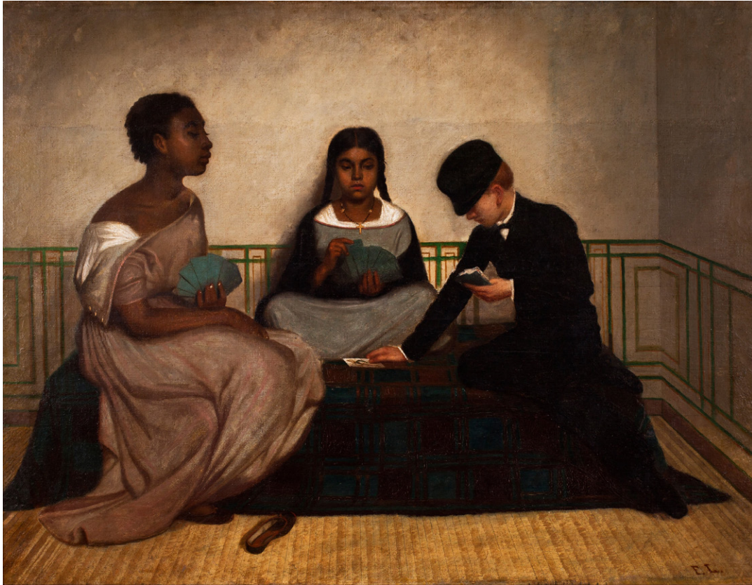
Francisco Laso: "Las tres razas o la igualdad ante la ley"

Depois que as duas obras foram expostas e observadas, faça algumas perguntas instigadoras: