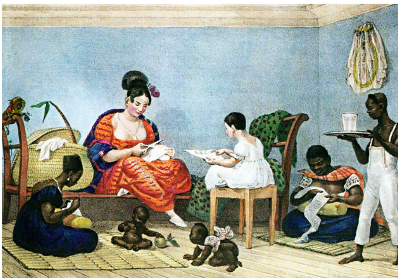
Jean-Baptiste Debret: “Uma senhora brasileira em seu lar”

Para sensibilizar os alunos com o tema, você deverá apresentar duas obras plásticas. Apresente primeiro, sem adiantar o assunto desta sequência didática, a obra de Jean-Baptiste Debret: “Uma senhora brasileira em seu lar” , de 1823. Dê alguns minutos para que apreciem, em silêncio, a pintura.